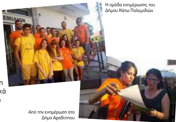
Η ομάδα ενημέρωσης του Δήμου Κάτω Πολεμιδιών

Η ΑΦΗΣ διοργάνωσε εκστρατεία ενημέρωσης από πόρτα σε πόρτα για την ανακύκλωση μπαταριών στους Δήμους Αραδίππου και Κάτω Πολεμιδιών. Η εκστρατεία ξεκίνησε στις 15 Ιουνίου και ολοκληρώθηκε στις 4 Ιουλίου. Στόχος της συγκεκριμένης εκστρατείας ήταν η πρόσωπο με πρόσωπο ενημέρωση όλων των κατοίκων των συγκεκριμένων Δήμων για την ανακύκλωση μπαταριών, συσκευασιών και ηλεκτρικών και ηλεκτρονικών συσκευών. Οι ειδικά εκπαιδευμένες ομάδες της ΑΦΗΣ κατά την ενημέρωση, συζητούσαν μαζί με το κοινό, έλυναν απορίες και μοίραζαν ενημερωτικά φυλλάδια. Η εκστρατεία έτυχε πολύ θετικής ανταπόκρισης από το κοινό.