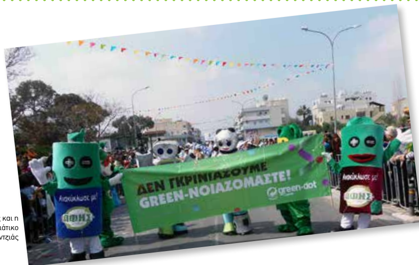
Ο Μπαταριούλης και η Μπαταριούλα στο Αποκριάτικο Καρναβάλι της Αγλαντζιάς

Η ΑΦΗΣ συμμετείχε με τις δικές της μασκότ στο Καρναβάλι της Αγλαντζιάς στις 23 Φεβρουαρίου. Με τη συμμετοχή τους οι μασκότ έδωσαν στο καρναβάλι μια πράσινη νότα, υπενθυμίζοντας στους παρευρισκομένους τη σημασία της ανακύκλωσης για μια καλύτερη ποιότητα ζωής για όλους μας.