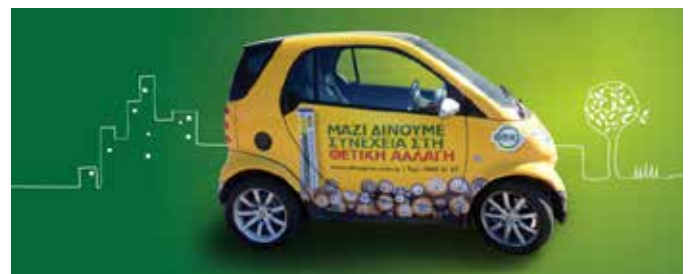
Τα αυτοκίνητα ντυμένα με τα μηνύματα του Οργανισμού

Παράλληλα, από τις 4 Μαρτίου και για περίοδο πέραν των τριών μηνών, κυκλοφορούσαν στους δρόμους της Κύπρου τέσσερα διαφημιστικά αυτοκίνητα Smart, ντυμένα με τα χρώματα της ΑΦΗΣ, δίνοντας με αυτό τον τρόπο στην ΑΦΗΣ την ευκαιρία να μεταδώσει το μήνυμά της σε όσο το δυνατόν περισσότερο κόσμο.