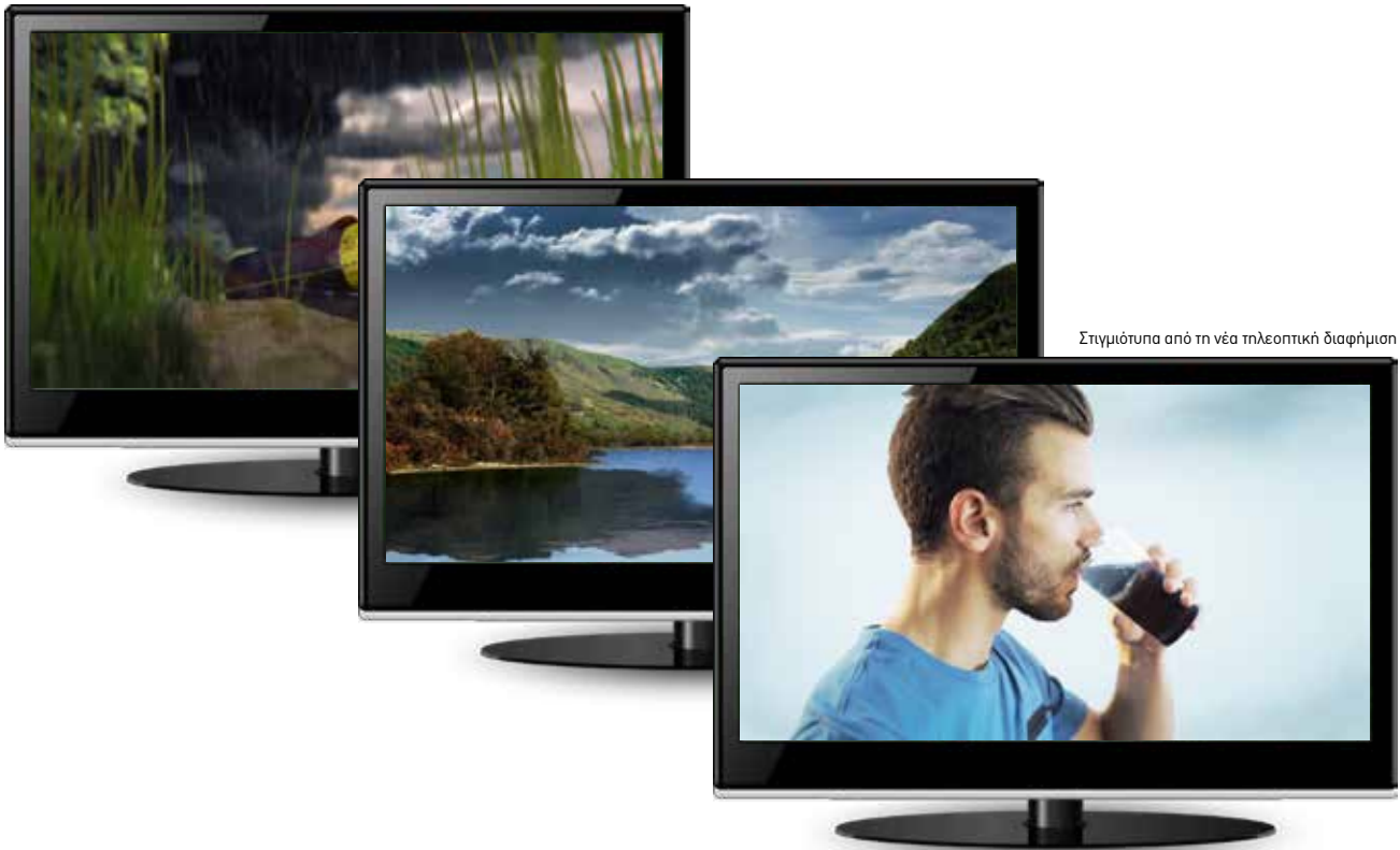
Στιγμιότυπα από τη νέα τηλεοπτική διαφήμιση

Το δεύτερο εξάμηνο του 2014, η ΑΦΗΣ παρουσίασε μια νέα τηλεοπτική διαφήμιση με διαφορετική και πιο επιθετική προσέγγιση. Στόχος αυτή τη φορά ήταν η ευαισθητοποίηση και ενημέρωση του κοινού μέσω της ανάδειξης των βλαβερών συνεπειών που προκύπτουν από τη λανθασμένη απόρριψη των μπαταριών στο περιβάλλον. Μέσω της συγκεκριμένης διαφήμισης τονιζόταν πως οι αρνητικές αυτές συνέπειες δεν είναι άμεσα ορατές, αλλά έχουν αντίκτυπο σε μας μέσω των τροφών, του νερού και του αέρα. Τα συνεπακόλουθα της ρύπανσης δεν είναι μακριά μας ούτε χρονικά ούτε χωρικά. Είναι κοντά μας και μας επηρεάζουν καθημερινά. Αυτή η προσέγγιση στην επικοινωνία κρίθηκε ότι θα βοηθήσει περισσότερο από την απλή παρότρυνση για ανακύκλωση, αφού ειδικά στις μπαταρίες, η απόρριψη τους στο περιβάλλον είναι σημαντικό περιβαλλοντικό πρόβλημα λόγω του τοξικού τους περιεχομένου. Η τηλεοπτική καμπάνια προβλήθηκε από τις 24 Σεπτεμβρίου μέχρι τις 19 Οκτωβρίου και απέσπασε πολύ θετικές κριτικές.