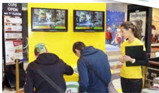
Στιγμιότυπα από τη Χριστουγεννιάτικη εκδήλωση