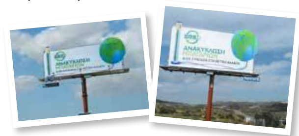
Πινακίδες εξωτερικού χώρου με τη διαφήμιση της ΑΦΗΣ για "θετική αλλαγή"

Παράλληλα, με την πρώτη τηλεοπτική εκστρατεία του έτους και τις υπόλοιπες δράσεις, τοποθετήθηκαν σε διάφορα σημεία όλων των αυτοκινητοδρόμων της χώρας, πινακίδες εξωτερικού χώρου, οι οποίες προέβλεπαν τη συνεισφορά της ανακύκλωσης μπαταριών στην προστασία του περιβάλλοντος και παρότρυναν το κοινό να ανακυκλώνει τις μπαταρίες του στους κάδους της ΑΦΗΣ. Αρκετές από τις πινακίδες εξωτερικού χώρου που προέβλεπαν τα μηνύματα του Οργανισμού παρέμειναν τοποθετημένες μέχρι το τέλος του έτους.