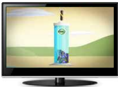
Από το φιλμάκι της Υδατοπρομήθειας Λευκωσίας για την προστασία του νερού