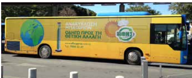
Το Λεωφορείο ντυμένο με τα μηνύματα του Οργανισμού

Καθ' όλη τη διάρκεια του 2014 κυκλοφορούσε στους δρόμους της Λευκωσίας λεωφορείο «ντυμένο» με τα χρώματα και τα μηνύματα της ΑΦΗΣ. Με το σύνθημα «Οδηγώ προς τη Θετική Αλλαγή», γινόταν γνωστή προς το κοινό η ανακύκλωση μπαταριών με απώτερο σκοπό την προτροπή και ενεργή συμμετοχή του στο πρόγραμμα ανακύκλωσης. Το λεωφορείο άλλαζε διαδρομή κάθε δύο περίπου μήνες, ώστε να το δει όσο το δυνατόν περισσότερος κόσμος.