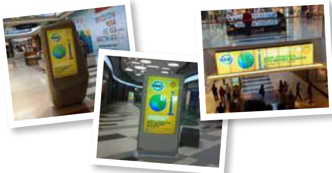
Οι διαφημίσεις της ΑΦΗΣ σε εμπορικά κέντρα

Η ΑΦΗΣ μετέδωσε στο κοινό τα μηνύματά της για την ανακύκλωση μπαταριών και μέσω διαφημίσεων σε εμπορικά κέντρα. Συγκεκριμένα η προβολή των μηνυμάτων του Οργανισμού ξεκίνησε στα μέσα Μαρτίου στο «The Mall of Cyprus» στη Λευκωσία, στο «My Mall» στη Λεμεσό και στο «Kings Avenue Mall» στην Πάφο και διήρκεσε για δύο περίπου μήνες.