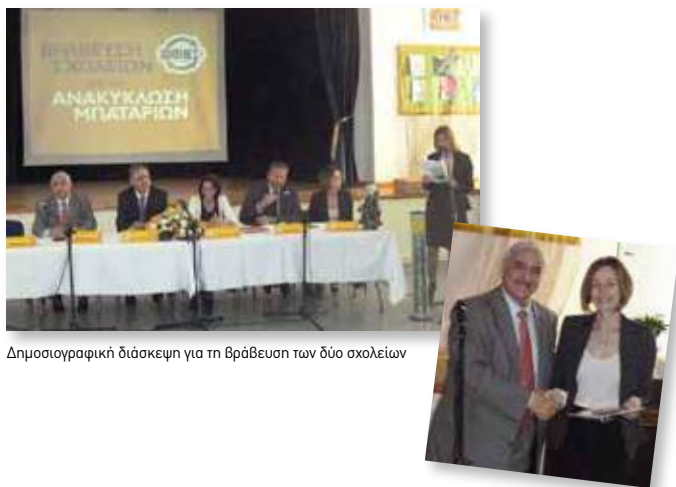
Δημοσιογραφική διάσκεψη για τη βράβευση των δύο σχολείων

Η ΑΦΗΣ βράβευσε τα δύο σχολεία με τις υψηλότερες επιδόσεις στη συλλογή μπαταριών για το 2013, σε κοινή διάσκεψη τύπου με τον Υπουργό Παιδείας και Πολιτισμού κ. Κώστα Καδή στην παρουσία και της Επιτρόπου Περιβάλλοντος κας Ιωάννας Παναγιώτου. Τα βραβευθέντα σχολεία ήταν το Δ' Δημοτικό Σχολείο Λεμεσού (ΚΑ') και το Δημοτικό Σχολείο Αγίων Αναργύρων Λεμεσού. Στα δύο σχολεία δόθηκε ως βραβείο ηλεκτρονικός εξοπλισμός αξίας 500 ευρώ για τις ανάγκες του κάθε σχολείου. Παράλληλα, άλλα δεκατρία σχολεία σε όλη την Κύπρο τιμήθηκαν με επαίνους για την επίδοσή τους στην ανακύκλωση μπαταριών το 2013.