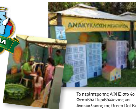
Το περίπτερο της ΑΦΗΣ στο 4ο Φεστιβάλ Περιβάλλοντος και Ανακύκλωσης της Green Dot Κύπρου