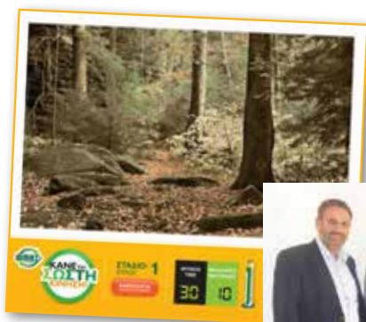
Από το Διαδικτυακό Διαγωνισμό