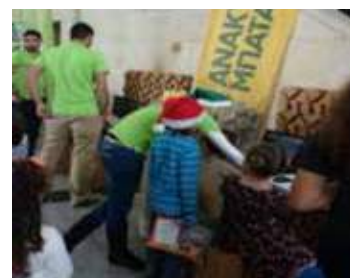
Στη "Χριστουγεννιάτικη Φιέστα" του Αντικαρκινικού Συνδέσμου Κύπρου

Η ΑΦΗΣ συμμετείχε το Σάββατο 6 Δεκεμβρίου, στη «Χριστουγεννιάτικη Φιέστα», την ολόημερη χριστουγεννιάτικη εκδήλωση που διοργανώνει κάθε χρόνο ο Αντικαρκινικός Σύνδεσμος Κύπρου. Η εκδήλωση πραγματοποιήθηκε στα κεντρικά γραφεία της ΑΗΚ στη Λευκωσία με σκοπό την ενίσχυση του Αντικαρκινικού Συνδέσμου Κύπρου.